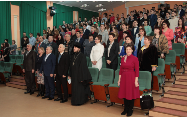
Звучит гимн студенческой поры: "Gaudeamus igitur!.."