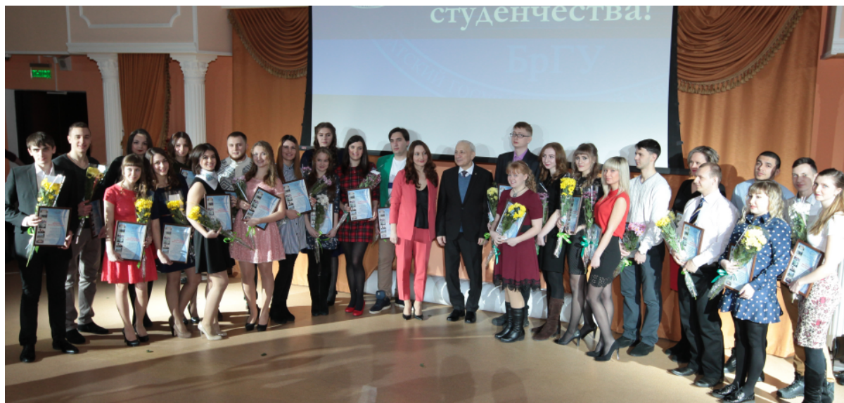
25 января в альма-матер состоялось традиционное празднование Дня Российского студенчества - Татьянин день

И на этот раз организаторы Татьянин дня решили не изменять традиции и провести диалог студентов с представителями власти. К такому моменту организаторы подошли весьма креативно, чтобы заинтериговать студентов и настроить их