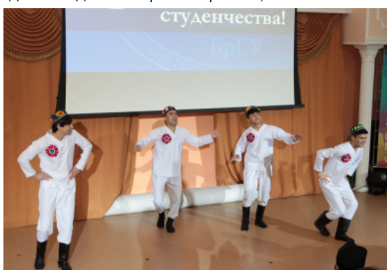
Выступление иностранных студентов

P.S. Организовали чудесный праздник отдел внеучебной работы со студентами, студенческий совет, студклуб при поддержке профкома студентов, отдела ТСО, иностранных студентов. Всем огромное спасибо!