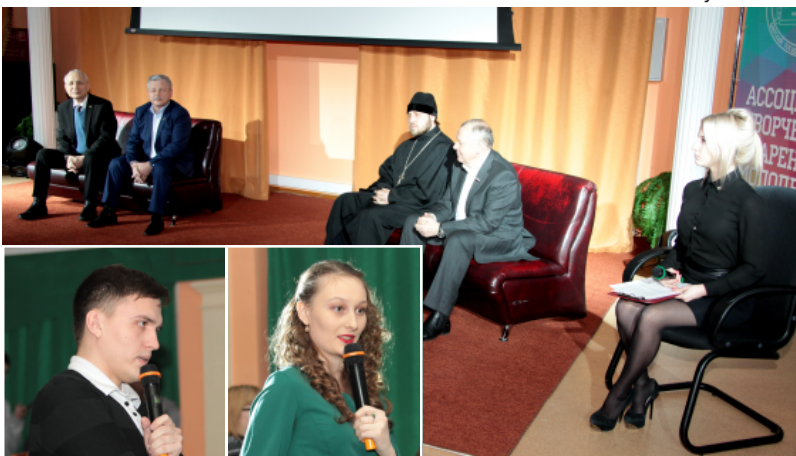
Студенты задают вопросы...

насыщенной жизни университета в прошедшем году. Спасибо медиа-лаборатории за профессиональную работу!