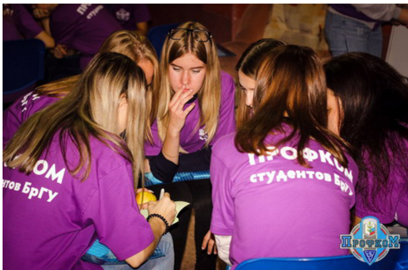
Мастер-класс по психологии убеждения

Дарья ТРОФИМОВА, Анастасия КУЧЕРОВА