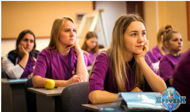
Теперь мы знаем, кому и какая стипендия выплачивается

ремонию награждения отличившихся учеников "Школы профактива - 2017" (отрадно отметить, что ярких лидеров этой школы было более 10 человек).