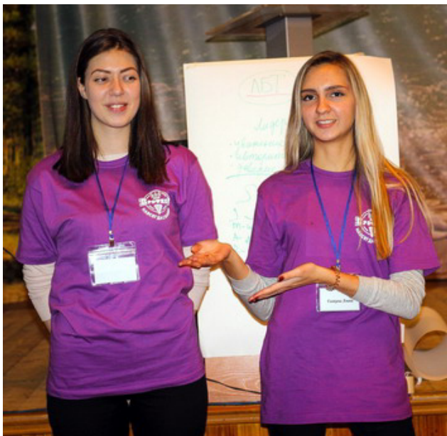
ЛБТ-лидером быть трудно

После работы в каждой подгруппе выявлялись активные и интересные студенты, которые задавали волнующие и насущные вопросы и активно участвовали в мастер-классах. Такие студенты получали определённые денежки - "профвзноски", которые в дальнейшем они могли обменять на сувенирную ярмарке профсоюза. Вкусно поужинав, профорги отправились в актовыв зал на це-