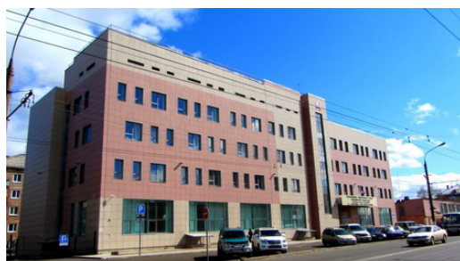
Адрес УПФР в Братске и Братском районе: 665717, г. Братск, ул. Комсомольская, 42а.

С 1 января 2017 года функции по администрированию страховых взносов от Пенсионного фонда России переданы Федеральной налоговой службе, и страхователям важно чётко понимать: какую отчётность они теперь направляют в налоговые