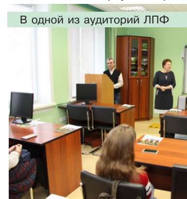
В одной из аудиторий ЛПФ