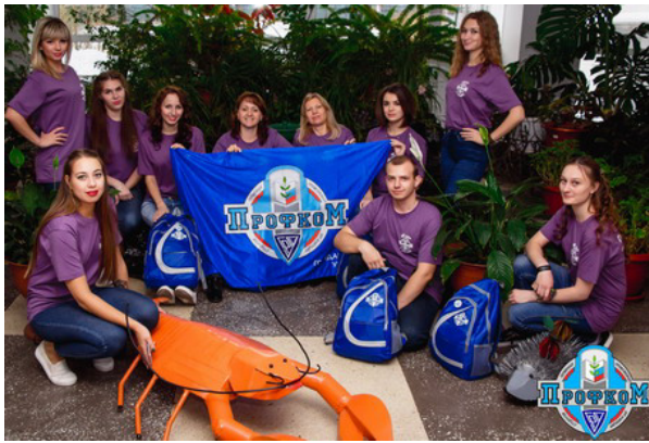
2016 год, первый городской форум "Молодёжь! Профсоюз! Будущее!"

Большой вклад в рамках информационной работы принадлежит коллективу редакции газеты