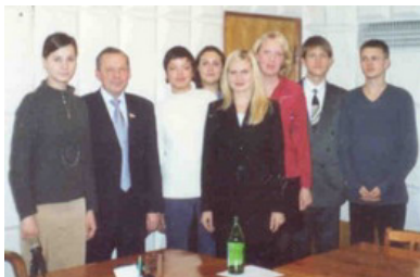
Декабрь 2002 года, одна из многочисленных встреч профактива с депутатом Госдумы РФ шести созывов, ныне сенатором от Приангарья В.Б. Шубой (второй слева)

Сегодня первичная профсоюзная организация студентов БрГУ, как и сорок лет назад, остаётся главным гарантом и защитником социаль-