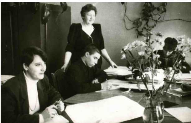
Начало 90-х, работа в профкоме студентов кипит

Так, в 1982 году обкомом Профсоюза было принято решение о введении в структуру профкома студентов БрИИ штатных единиц директора студенческого клуба, председателя спортивного клуба и главного бухгалтера профкома с выделением целевого финанси-