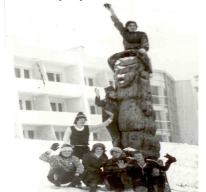
Оздоровительный выезд в "Северный Артек" в начале 80-х