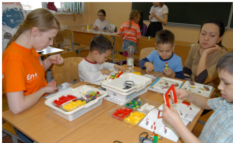
"Легодром" Lego WeDo

11 февраля в Братском государственном университете состоялся ежегодный межмуниципальный фестиваль науки и робототехники - 2017. Организаторы - БрГУ и лицей -1, спонсор - группа компаний EN-групп. В фестивале приняли участие учащиеся школ Братска, Иркутска, Усолье-Сибирское - 11 образовательных учреждений, 74 команды и 138 участников.