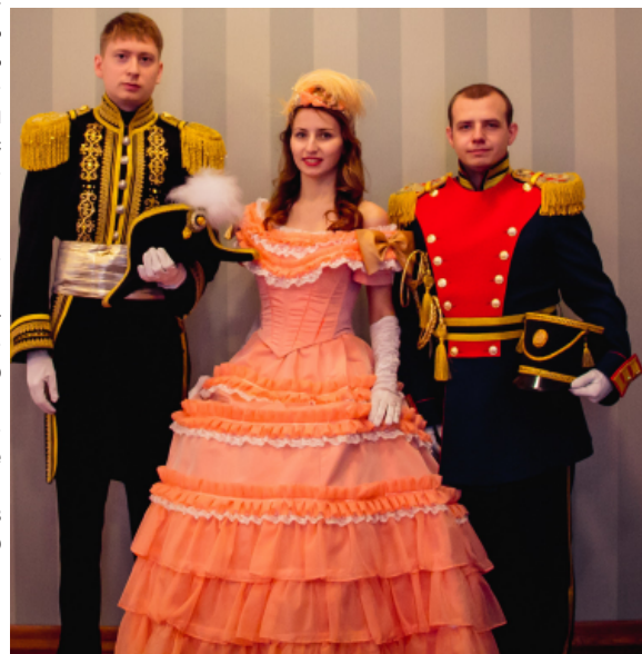
Студенты БрГУ в костюмах 17-го века

Во второй день состоялась посещение музея-квартиры А.С. Пушкина. Вся экскурсия была пронизана любовью и уважением к прекрасному русскому поэту. Мы узнали много интересного о его жизни и творчестве. На этом наш день не закончился, нас ждала такая же