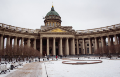
Люблю тебя, Петра творенье, Люблю твой строгий, стройный вид, Невы державное течение, Береговой её гранит... (А.С. Пушкин)