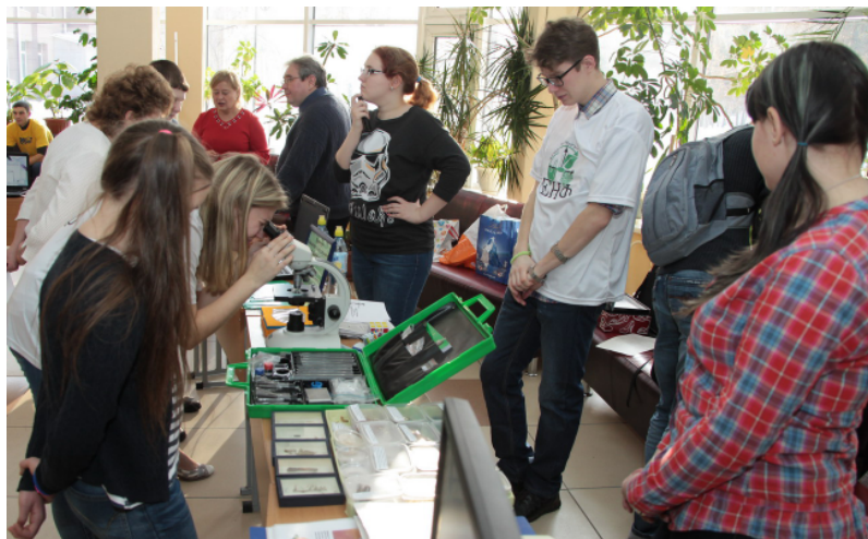
Выставка естественнонаучного факультета

Марина РАГЕСТВЕРТ