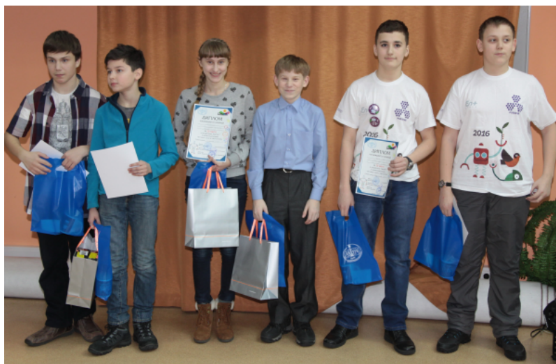
С робототехникой мы дружим!