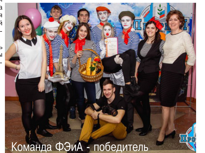
Команда ФЭиА - победитель

тетов порадовали высоким уровнем подготовки и сплочённостью работы команд. Отдельные слова благодарности адресуем мамам студентов, которые пришли поддержать их. Здорово, что они посещают такие мероприятия уже не первый год! Спасибо огром-