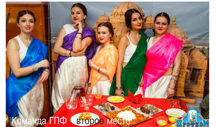
Команда ГПФ - второе место

Итак, конкурс закончился, мы надеемся, что он надолго оставит