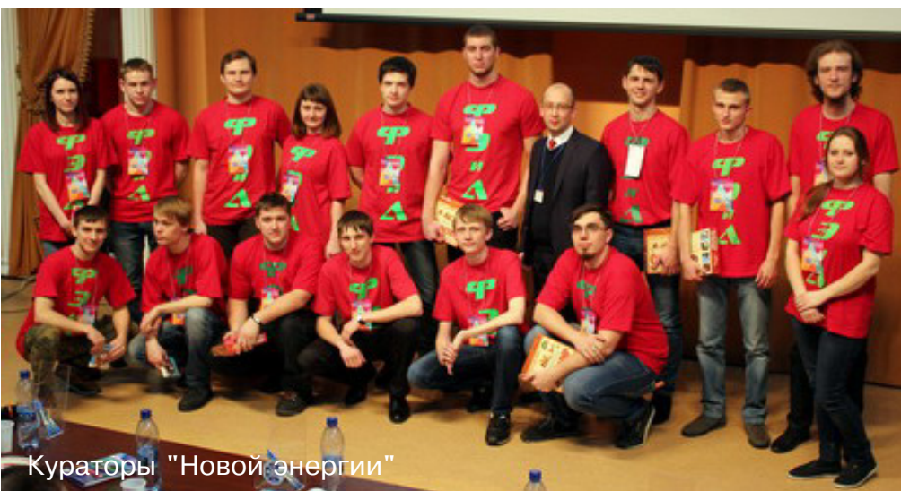
Кураторы "Новой энергии"

В 13.30 участникам была предоставлена возможность вос-