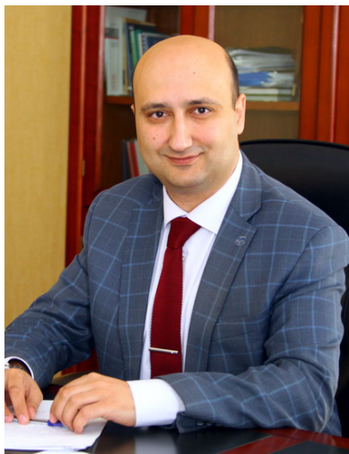
Уважаемые студенты! Дорогие коллеги! Друзья! От всей души поздравляю вас с Днём знаний и началом нового учебного года!