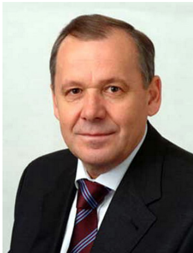
Уважаемые студенты, профессорско-преподавательский состав, сотрудники Братского государственного университета!

От всей души поздравляю вас с праздником - Днём знаний!