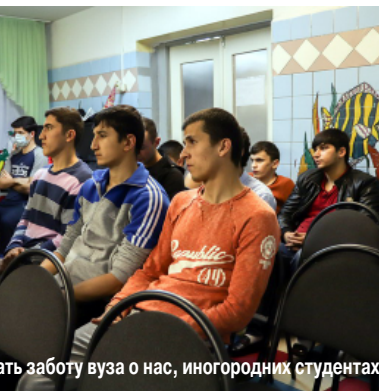
Постараемся оправдать заботу вуза о нас, иногородних студентах