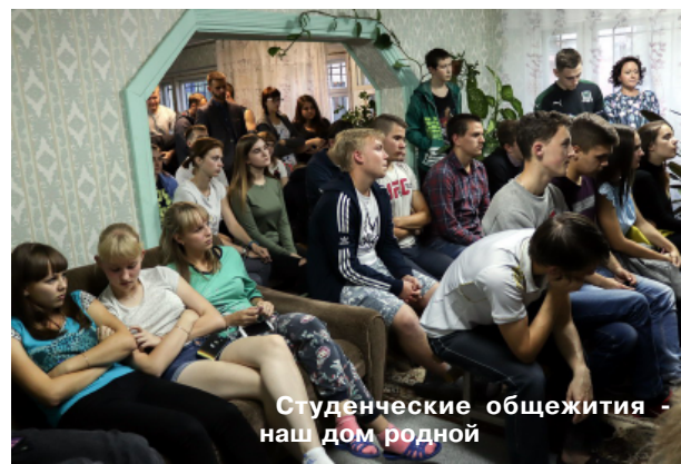
Студенческие общежития - наш дом родной

женская, информируя о правилах поведения в общественных местах, комендантском часе и мерах наказания за нарушения закона. В этом году это стало особенно важным в связи с заселением в общежитие несовершеннолетних студентов педагогического и целлюлозно-бумажного колледжей.