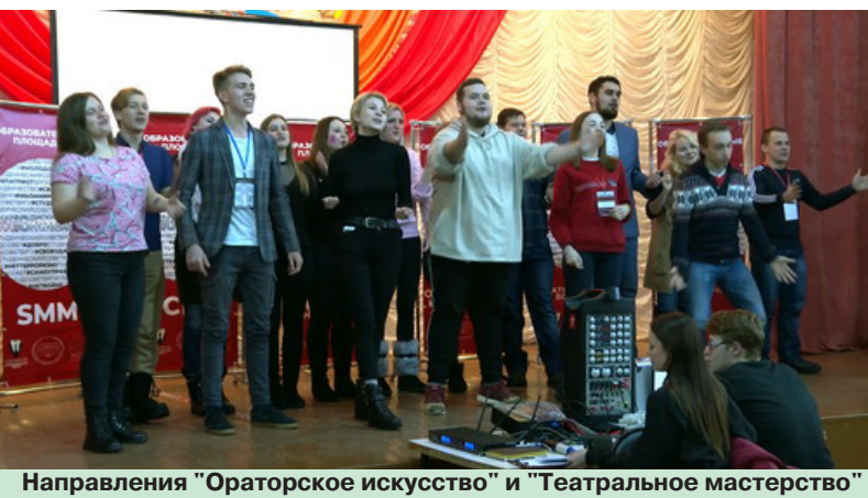
Направления "Ораторское искусство" и "Театральное мастерство"

Мargarита ИСАКОВА