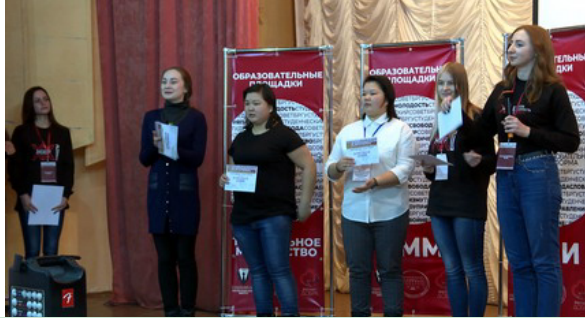
Вручение сертификатов участников межрегионального форума "МИР. XXI - 18"