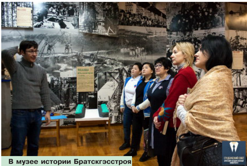
В музее истории Братскгэсстроя

Вместе с коллективом университета стали свидетелями закладки капсулы с обращением нынешних студентов к будущим, которые смогут прочесть текст послания через 19 лет - к 80-летию БрГУ.