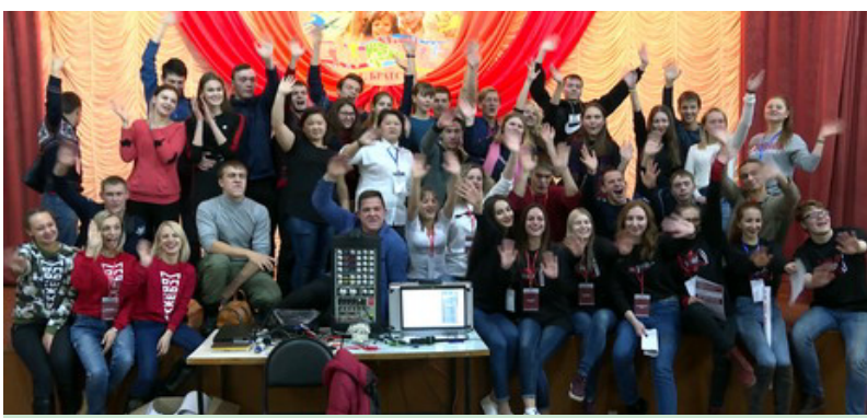
До свидания, гостеприимный Братский государственный университет!

Участники форума, удобно разместившиеся в университетском