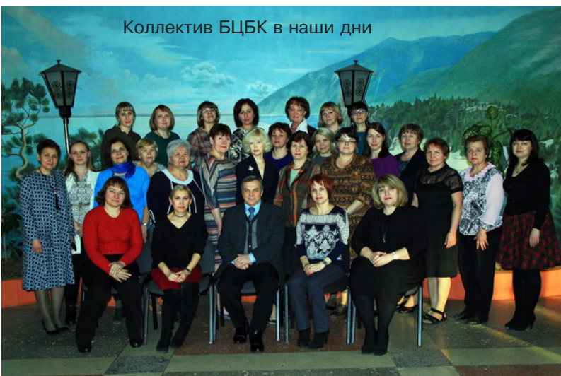
Коллектив БЦБК в наши дни