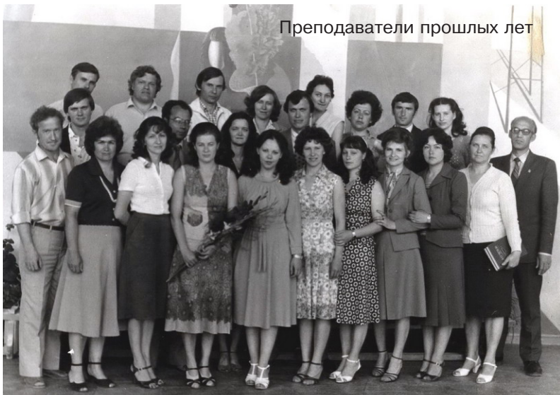
Преподаватели прошлых лет