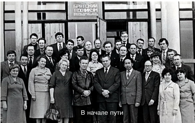
В начале пути

По результатам работы 2002 года студенческий клуб колледжа занял 1-е место и был удостоен