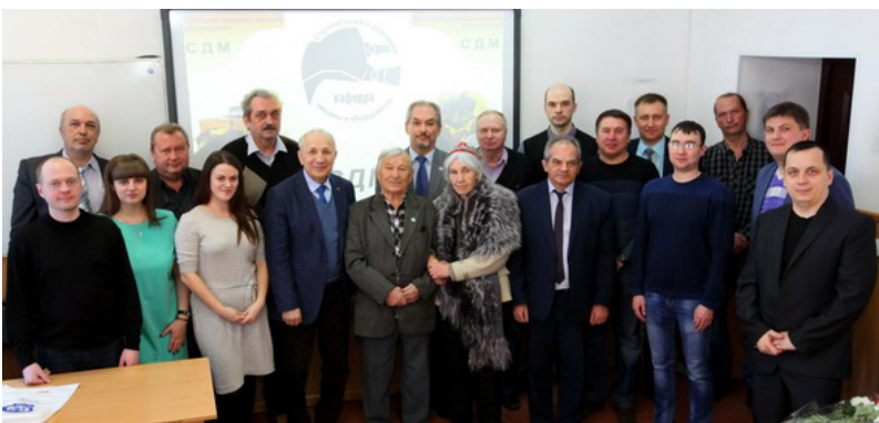
Пусть все оставшиеся годы Несут Вам радость от души!

Не подыскать такого слова, Чтоб в полной мере пожелать Вам отличного здоровья И никогда не унывать. Желаем счастья и добра, Поменьше горя и печали, Чтоб больше было светлых дней, А хмурые - не посещали. Но в день чудесный юбилея Все пожеланья хороши.