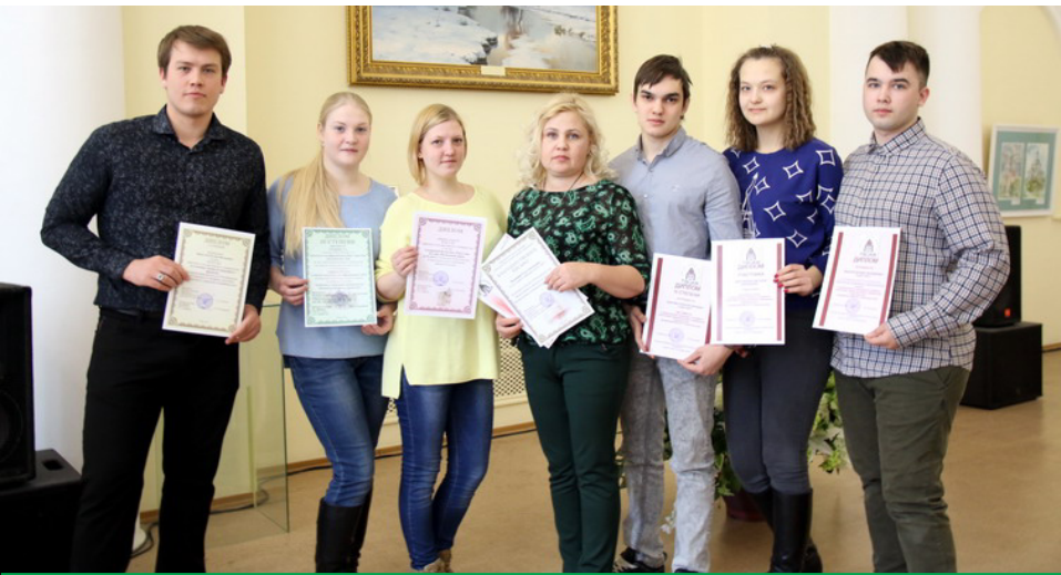
Университет гордится вами, ребята! И благодарит ваших талантливых наставников - преподавателей кафедры СКИТС. Поздравляем с отличными результатами и желаем новых успехов!

Студентам было необходимо за три часа спроектировать двухпролетное промышленное здание, показать значимые разрезы, план, узлы, а также дать алгоритм расчёта строительных конст-