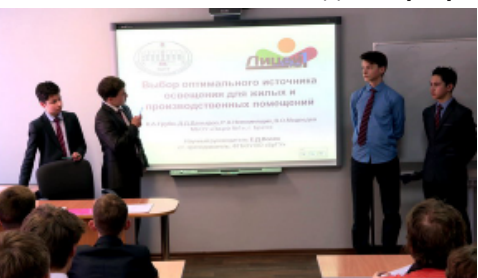
Выступление лицейистов на научной конференции в БрГУ