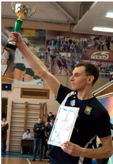
Заветный Кубок уезжает в Братск!

го университета (Махачкала). В финале наша команда сошлась в поединке с Ивановским химико-