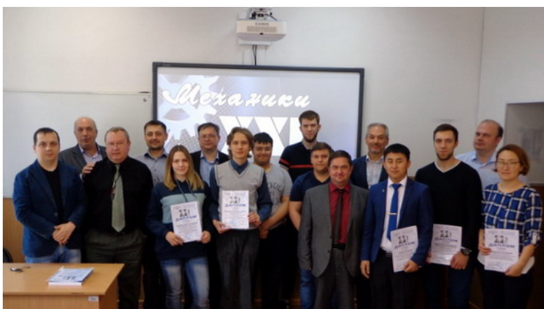
Дружная команда конференции "Механики XXI века"

В работе конференции приняли участие студенты и преподаватели механического факультета БрГУ, представители произ-