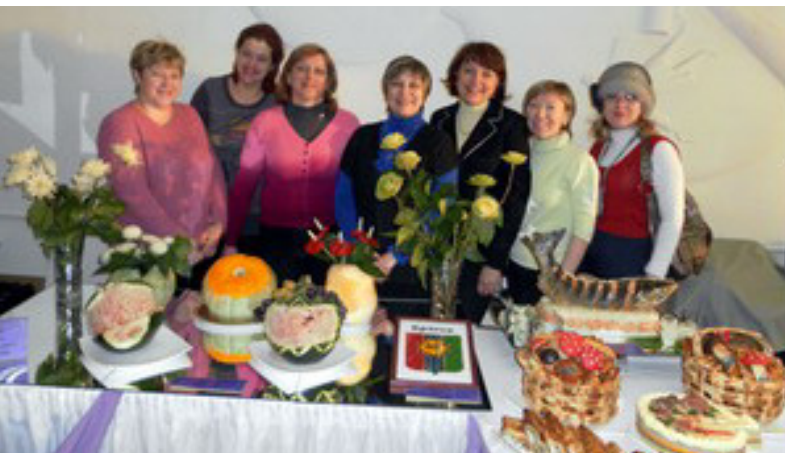
Коллектив столовой БрГУ неоднократно становился победителем и призёром городских конкурсов кулинарного мастерства

Добрые слова благодарности адресуем добросовестной посу-