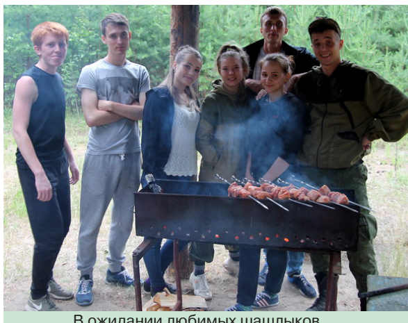
В ожидании любимых шашлыков

лесу и утомительные физические нагрузки в светлое время суток (а работали мы весь световой день с перерывом на обед) уже не напоминали о себе, когда мы возвращались к месту отдыха.