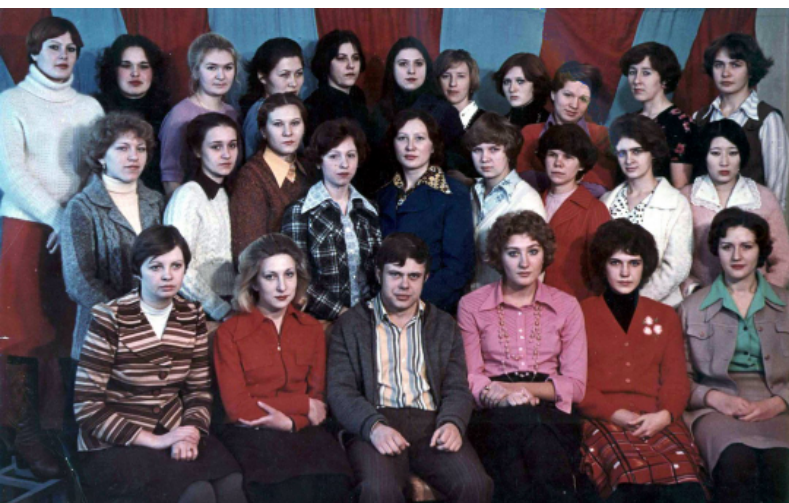
Первый выпуск экономистов в 1980 году

- с 2002 года кафедра начала подготовку специалистов по специальности "Экономика и управление на