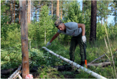
Заготовить колышки - нет проблем

Мы очень надеемся, что умения и опыт практической деятельности по закладке пробных площадей, проведению рубок осветления при уходе за лесом, а также ис-