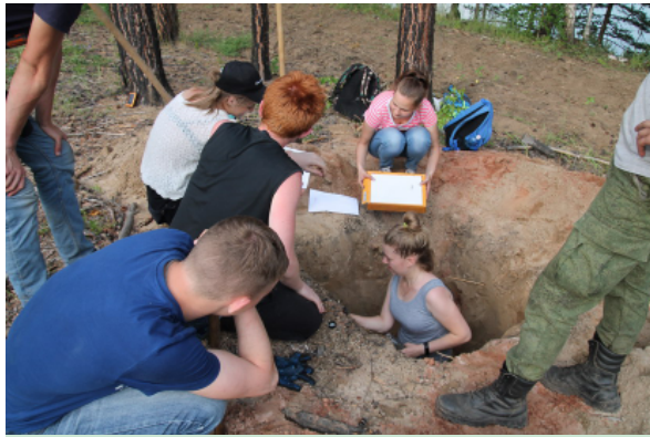
Изучение среза почвы

проводить определение объёма удалённой фитомассы путём обмера пачек с последующими вычислениями; исследовать лесную почву на специально выполнен-