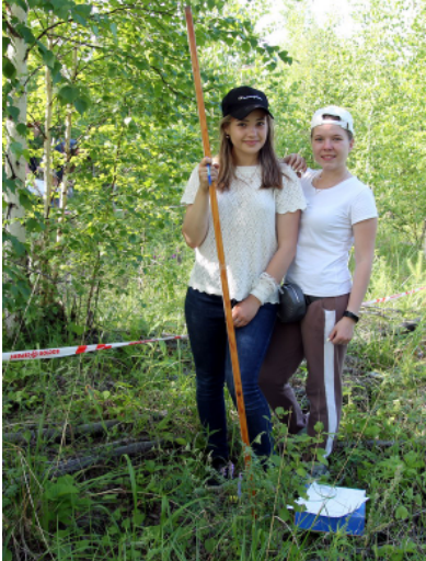
Готовы считать подрост и подлесок

Учебные, производственные, научно-исследовательские практики по многим направлениям подготовки бакалавров и магистров проводятся на территории учебно-опытного лесхоза, входящего в состав лесопромышленного факультета. Будущие историки, экологи и энергетики, механики и лесники уже не первый год получают бесценный практический опыт на острове Бурнина, что расположен вниз по течению реки Ангары в нижнем бьефе гидроэлектростанции.