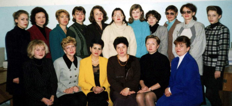
Коллектив кафедры 20 лет назад

выделена кафедра "Государственное и муниципальное управление"; - с 2004 года кафедра была переименована и стала называться кафедрой "Экономика и менеджмент". В этом же году кафедра осуществляет подготовку магистров по на-