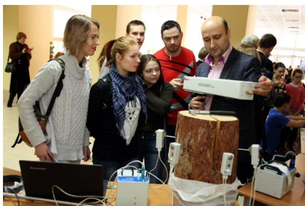
Фестиваль науки в БрГУ, 10 февраля 2018 года

Развивается наука и в высшей школе. Предлагаем вниманию читателей итоги научно-инновационной деятельности Братского государственного университета за 2018 год.