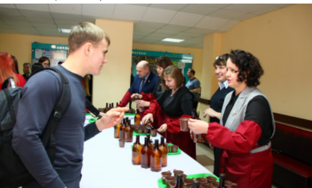
Подходите, дорогие студенты, угощайтесь!..