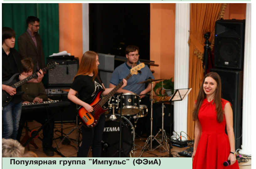
Популярная группа "Импульс" (ФЭИА)