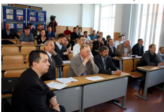
XVII Всероссийская научно-практическая конференция "Механика - XXI век", 16 мая 2018 года

лиям страна стала родиной выдающихся открытий и изобретений человеческой цивилизации. Россия стала первым государством, где было разработано учение о биосфере, впервые в мире в космос запущен искусственный спутник Земли, введена в эксплуатацию первая атомная станция. Постсоветскую эпоху принято считать временем глубокого кризиса в отечественной науке, однако и в 1990-е годы, и позже российским учёным удавалось и удаётся получать научные результаты мирового уровня.