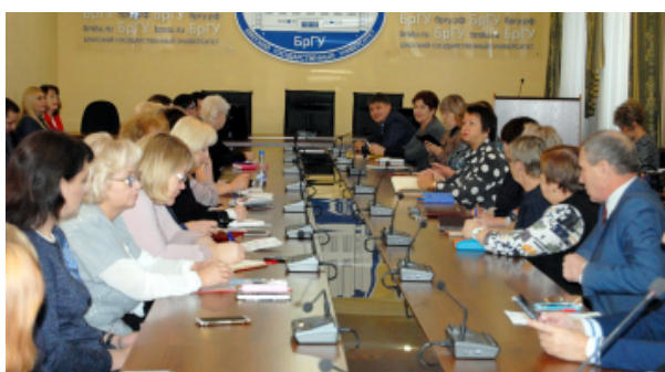
Начало мероприятия в зале учёного совета

Департамент образования - частый гость в БрГУ. На сей раз директора школ прибыли в наш вуз, чтобы стать