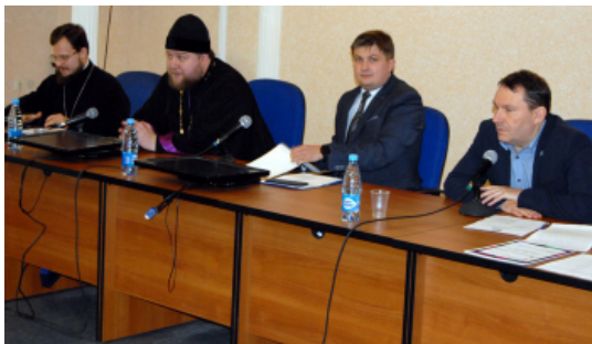
В конце ноября на площадке нашего университета Братская

епархия Русской православной церкви проводила коллегию Синодального отдела по делам молодёжи в Сибирском федеральном округе. В мероприятии приняли участие руководители профильных отделов 32 сибирских епархий, а также их помощники.