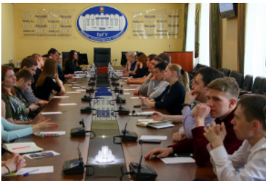
"Круглый стол" по теме: #Вместе против террора

полезной для студентов информации, которая размещена на официальном сайте университета в разделе "Противодействие коррупции". Кроме того, в выступле-