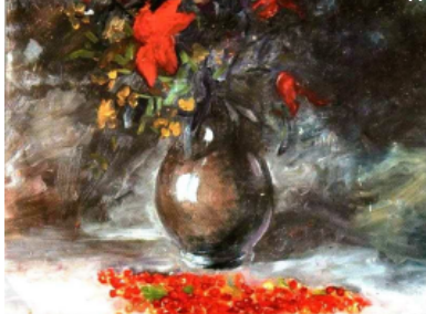
"Букет", масло, 54x43-см, 1974 год

вочника всех художников России, состоящая из 38 академиков, искусствоведов, народных художников, определила ему место в истории искусств нашей страны как "сложившийся профессионал с индивидуальным стилем".