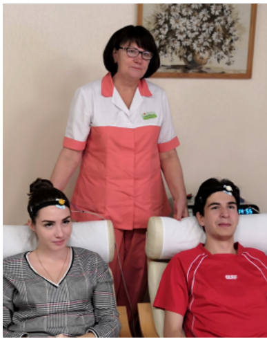
В кабинете психологической разгрузки.

Современный уровень цивилизации и культуры ставит перед любым человеком задачу в первую очередь самому научиться быть здоровым и вести здоровый образ жизни. Для этого необходимо, на мой взгляд, соблюдать духовно-нравственные нормы, оптимальный двигательный режим, рациональное питание, отказаться от вредных привычек и регу-