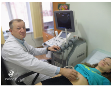
УЗИ - ультразвуковое исследование.

Современный уровень цивилизации и культуры ставит перед любым человеком задачу в первую очередь самому научиться быть здоровым и вести здоровый образ жизни. Для этого необходимо, на мой взгляд, соблюдать духовно-нравственные нормы, оптимальный двигательный режим, рациональное питание, отказаться от вредных привычек и регу-