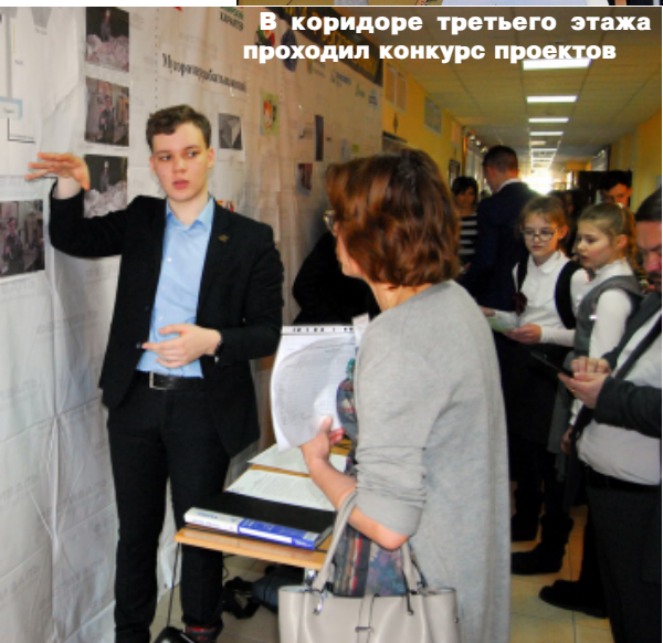
В коридоре третьего этажа проходил конкурс проектов

Кроме того, в коридоре третьего этажа проходил конкурс проектов, а в актовом зале - конкурс видеороликов "Вид сверху" и "Нау-учТВ".