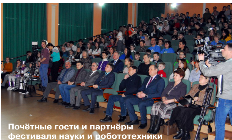
Почётные гости и партнёры фестиваля науки и роботехники

территории города, - ООО "Транснефть-Восток", филиал АО "Группы "Илим" в Братске и другие. Основная программа фестиваля включала в себя демонстрацию достижений школьников в направлении образовательной роботехники. Посетители смогли увидеть, каких роботов изобрели ребята и с какими задачами научили справляться. Родите-