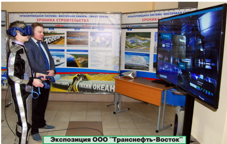
Экспозиция ООО "Транснефть-Восток"