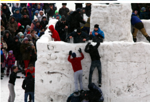
Штурм крепости под знаменитый марш "Прощание славянки"

бревна", "жарение блинов", "хождение на ходулях", "скакалка" и др. Конечно, не обошлось без