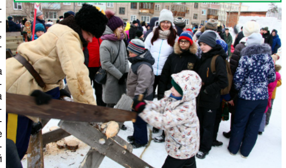
Распили-ка, внучок, ручной пилой брёвнышко...

и другими структурными подразделениями вуза. Спасибо всем, особенно студентам-игротехникам! А вот