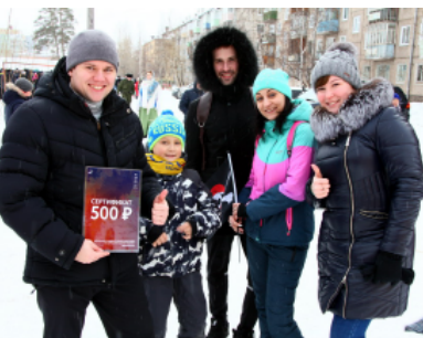
Победители состязаний "кидание бревна" и "поднятие гири", а также конкурса чашечек были награждены подарочными сертификатами, получив бурю аплодисментов зрителей