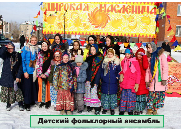
Детский фольклорный ансамбль

Так совпало, что в День защитника Отечества возле нашего вуза проходило любимое горожанами народное гулянье под названием "Брацкая Масленица" (она же Широкая).