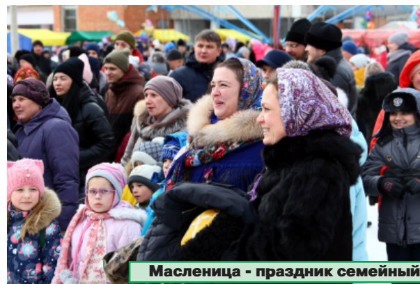
Масленица - праздник семейный

В завершение первой части программы народного гуляния ведущие объявили открытие "полян",