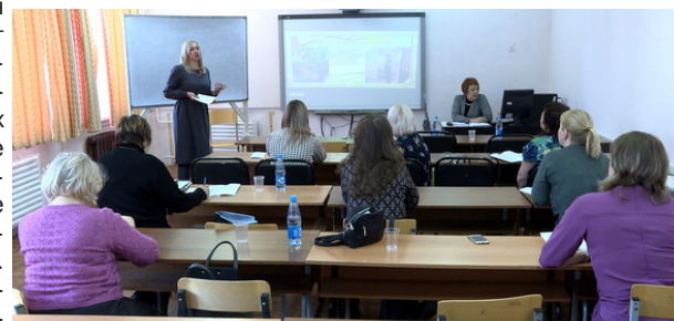
Секция "Экологическое образование как основа устойчивого развития общества"

малой Родине, общенациональная и этническая идентичность, уважение к культуре и традициям людей, которые живут рядом.