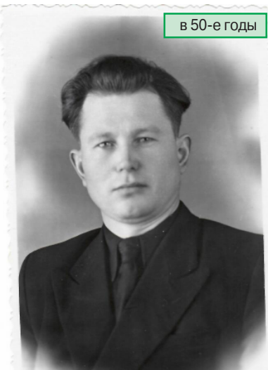
в 50-е годы