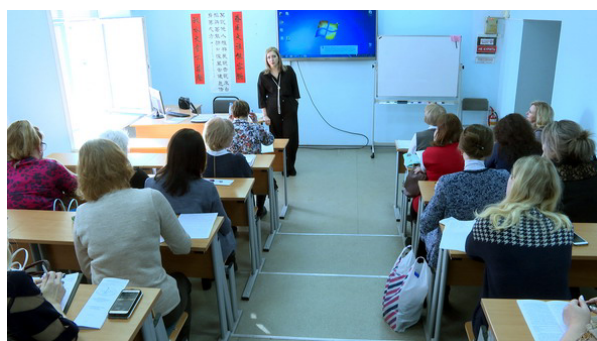
Секция "Особенности патриотического воспитания обучающихся"