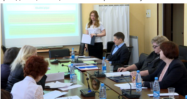
Секция "Информационные технологии в образовании"

ные доклады и сообщения. В секции № 1 - о системе менеджмента качества образовательного учреждения; в секции № 2 - об орга-