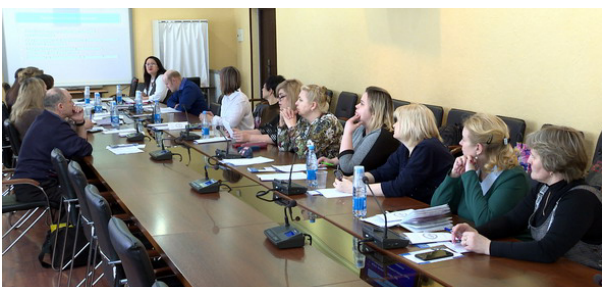
Секция "Организация воспитательной работы в новых социокультурных условиях"

товки работников - регионально-стандарта, призванного объединить усилия многих заинтересованных сторон для подготовки кадров международного уровня, в том числе региональных органов исполнительной власти, предприятий как заказчиков кадров, профессиональных образовательных организаций, вузов. Интересными нововведениями в системе среднего профессионального образования стали расширение возможности образовательных организаций в отношении формирования структуры и содержания образовательных программ, а также введение нового вида проведения государственной