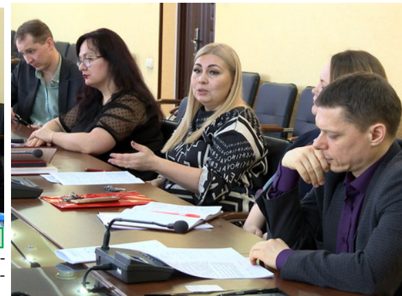
Итоговое заседание руководителей секций

нии интереса педагогов к проблеме патриотизма, что соответствует стратегии развития воспитания