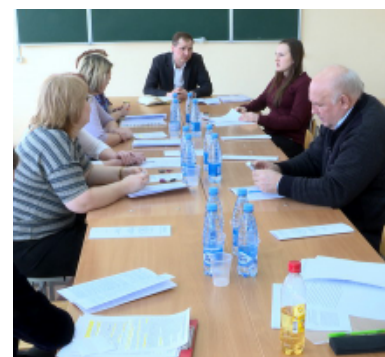
Секция "Качество подготовки и деятельности педагогических кадров"

в Российской Федерации, государственной программе "Патриотическое воспитание граждан Российской Федерации на 2016-2020 годы". Одной из основных задач современного образования является сегодня воспитание гражданина России - зрелого, ответственного человека, в котором сочетается любовь к большой и