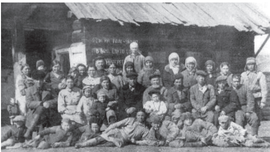
Колхозники Братского района в 1943 году

Беспредельным был вклад тружеников тыла в разгром врага. Самоотверженно трудились люди у станков, на колхозных полях, всюду, где требовалась помощь фронту. Свыше 16 миллионов трудящихся СССР награждены медалями за доблестный труд в годы войны.